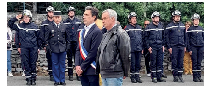
Recueillement devant l'Espace du Souvenir

Après les discours et le moment de recueillement, toute la population présente put se rendre au foyer du village où le verre de l'amitié les attendait, excellent moment de partage et de convivialité. Merci à nos écoliers de leur participation !