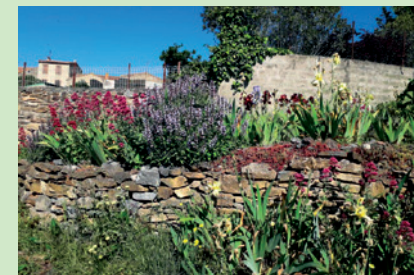
Massif de fleurs rue des amandiers

Fermeture du lundi 29 août au mercredi 14 septembre 2022 inclus