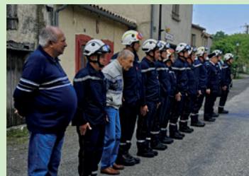
Route de Villardonnell